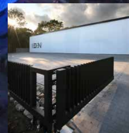
Eden Design Automation specialiseert zich in elektriciteitswerken, designverlichting en automatisatie.

Eén van de grote referentieprojecten van Eden Design en Beckhoff: De Ghelamco Arena in Gent.